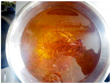
△栽培種日本茜の染(小樽)