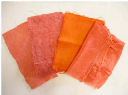
△日本茜染の綿、麻、羊毛、絹(広島)