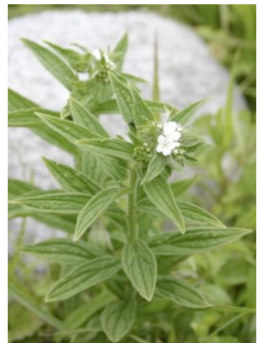
△自生種紫草の保全(福岡) 1997～2008 年会議、展示等 のポスター(東京、北海道)