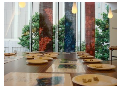
△天然の色共同制作と資料展(札幌)