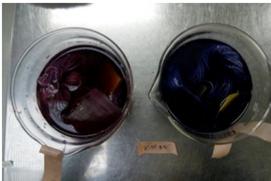
△北海道産紫根染:明礬と椿灰媒染(福山)