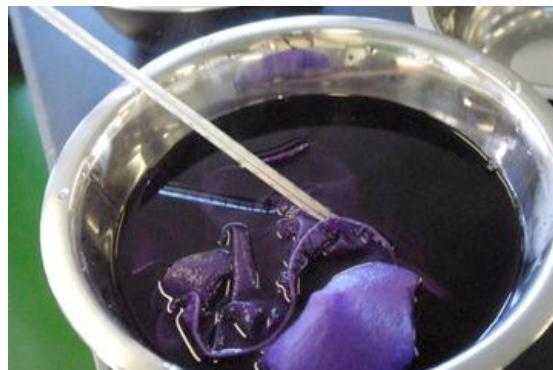
△北海道産紫根染:明礬石と井戸水による媒染(当別)