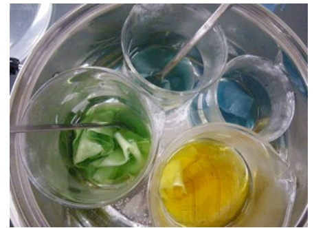
△黄檗と臭木染、その混色(札幌)