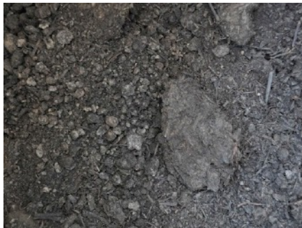
タデアイのすくも藍