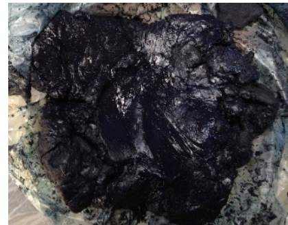
ナンバンコマツナギの沈殿藍