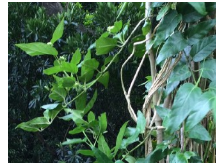
アイカズラ、ソメモノカズラ