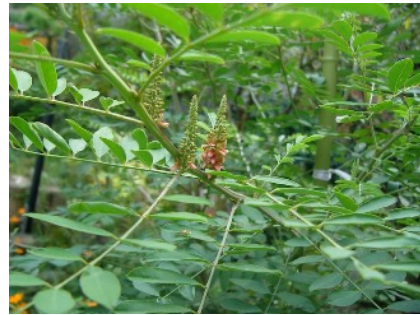
ナンバンコマツナギ