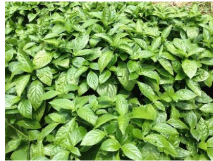
リュウキュウアイ