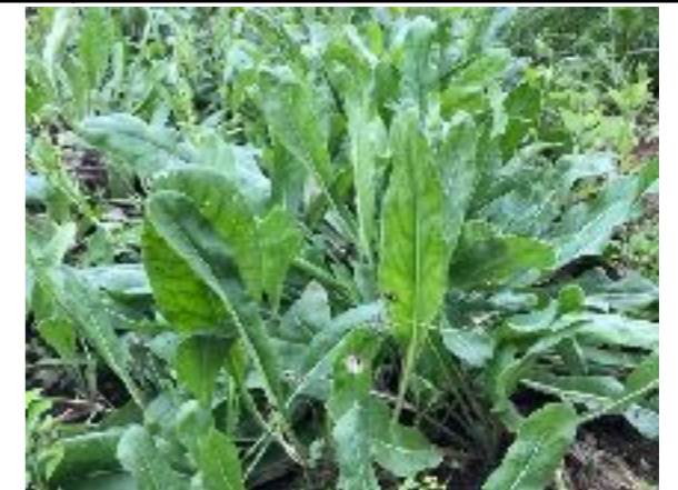
Isatis tinctoria yezoensis