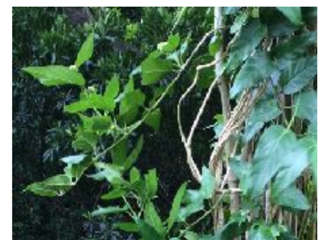
Marsdenia tinctoria tomentosa